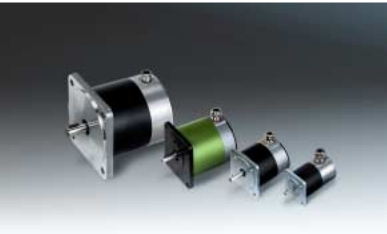
SM 168 SM 107 SM 87/88 SM 56

Sämtliche Kurven wurden unter Verwendung von STÖGRA Ansteuereinheiten gemessen.